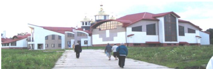
Université catholique ukrainienne

Le dernier jour de notre séjour, 21 juillet 2008, lors de la célébration de clôture, dans la chapelle du séminaire de Lviv, le père Beaupère prononce l'envoi suivant, traduit en ukrainien :