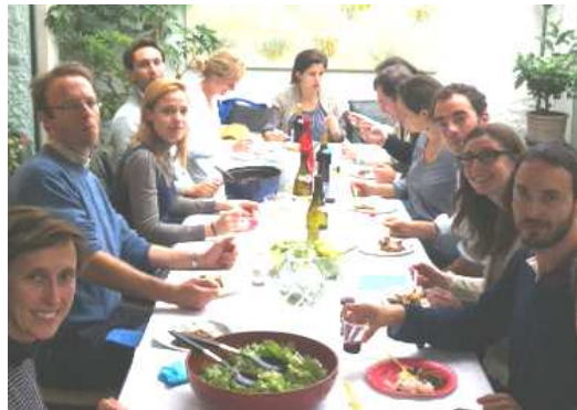
Jeunes Foyers Mixtes en 2012

Indépendamment de nos différences, le sujet de réflexion central pour nos couples est d'abord de savoir comment et quand pratiquer et transmettre notre foi de chrétien alors que notre mode de vie nous laisse très peu de temps libre et que nous vivons dans une société de moins en moins croyante et pratiquante. Pratiquer et témoigner de sa foi de chrétien dans un environnement au mieux indifférent est un défi partagé par les