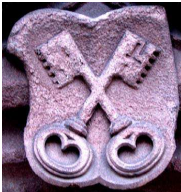
Strasbourg temple St Pierre le Jeune

Regardons par exemple quelques réalisations vécues dans chacune de nos régions : groupes d'étude interconfessionnels, expositions