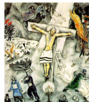
Cruxifixion blanche CHAGALL

Le dimanche matin au lever du jour à 7 heures, les chrétiens de la métropole lilloise se sont retrouvés sur le parvis de la nouvelle Maison Jean XXIII pour fêter ensemble la Résurrection du Christ.