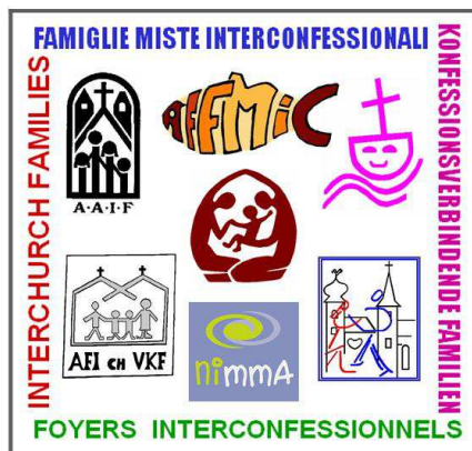
Logo de l'IFIN