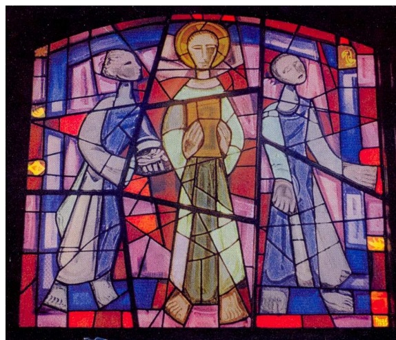
Chapelle du CSI – Vitrail du frère Eric de Taizé

Nous avons tous été attentifs à l'avenir du Centre qui sous l'impulsion du Père René Beupère nous accompagne depuis des décennies fructueuses d'œcuménisme. Beaucoup d'entre nous se sont mobilisés pour faire face aux problèmes financiers.