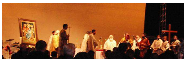
La Divine Liturgie orthodoxe

D'autres veulent donner un témoignage d'unité et d'amour tout en acceptant nos limites...sereinement.